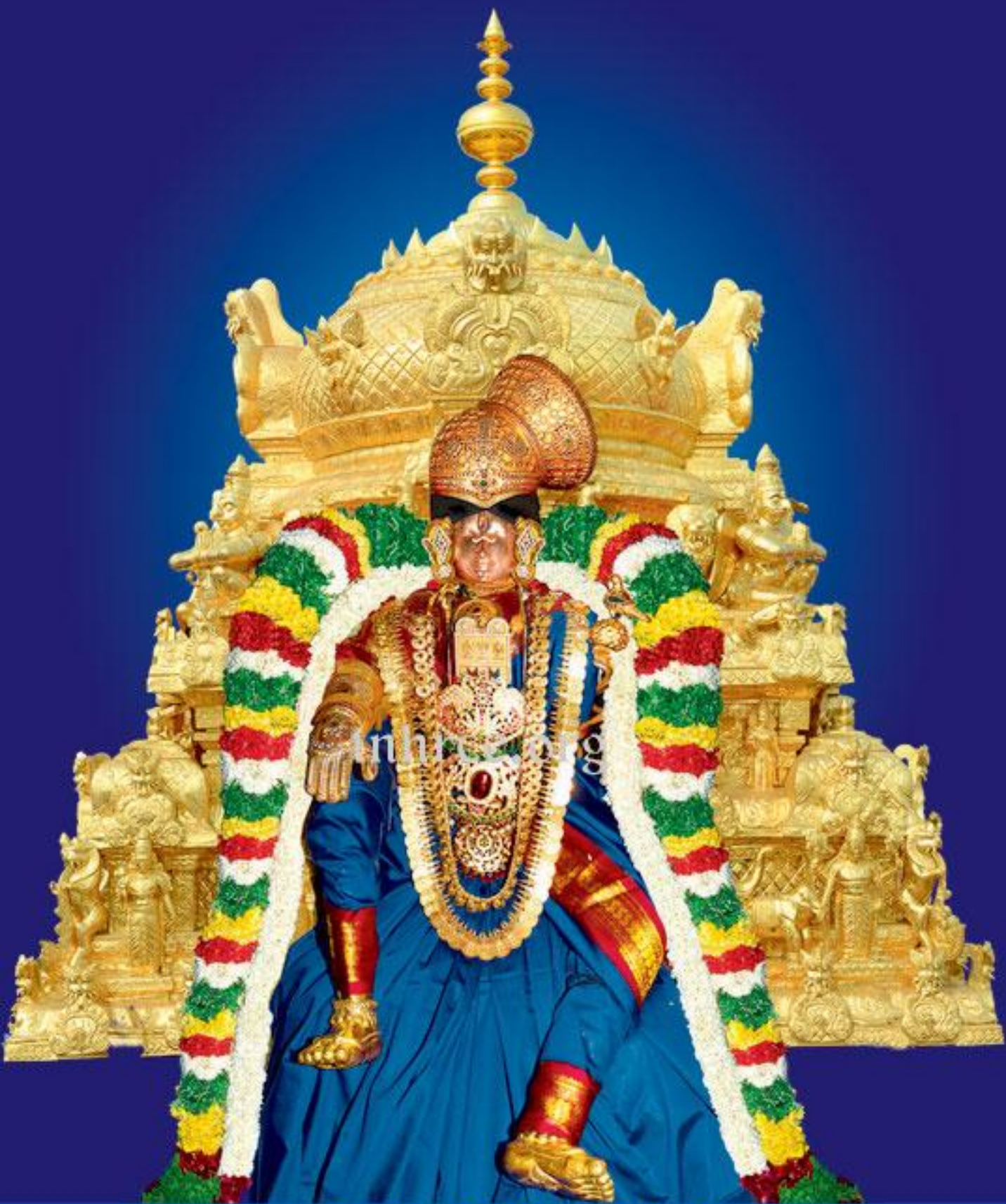
தங்க விமானத்தில் ஸ்ரீஆண்டாள்